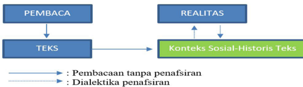
Gambar 6. Proses Penafsiran Teks-Realitas

Penafsiran yang berawal dari realitas ke teks dimulai dengan pembacaan realitas. Setelah itu, masalah yang didapatkan dari realitas itu dihadapkan pada teks. Dalam memahami teks, pengkaji melakukan pembacaan terhadap konteks sosial-historis teks. Hasilnya kemudian didialogkan dengan realitas pembaca. Hal ini berbeda dengan penafsiran yang berawal dari teks baru ke realitas seperti pada gambar berikut.