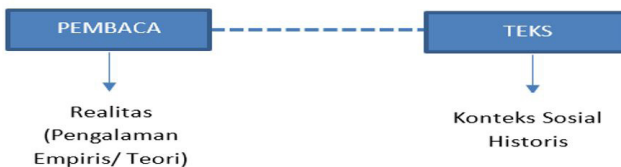
Gambar 3. Komponen Pembaca-Teks

Berdasarkan hasil pengamatan penulis, ada dua gerakan yang Rahardjo lakukan dalam menafsirkan Al-Qur’an di Ensiklopedi Al-Qur’an . Dua gerakan tersebut berkaitan erat dengan aktivitas membaca, memahami, dan menafsirkan yang melibatkan dua komponen utama, yakni pembaca dan teks. Jika dijabarkan, maka yang harus ada pada setiap komponen adalah pembaca memiliki pengalaman empiris sedangkan teks memiliki konteks sosio-historisnya. Dengan kata lain, ketika pembaca berhadapan dengan teks, masing-masing memiliki entitas berbeda. Peniadaan entitas salah satu di antaranya atau bahkan dua-duanya akan menghasilkan penafsiran yang gagal.