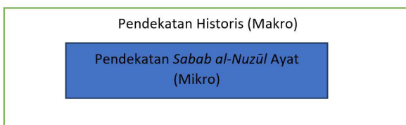
Gambar 2. Perbandingan Penggunaan Sabab an-nuzūl dan Pendekatan Historis

Pendekatan historis yang ditawarkan oleh Rahardjo dapat diperbandingkan dengan kaidah ‘āmm dan khāṣṣ . Secara umum juga dapat ditinjau dari kaidah asbāb an-nuzūl , al-‘ibrah bi ‘umūm al-laḥz lā bi khusūṣ al-sabab . Sejauh penelusuran penulis, Rahardjo memang tidak pernah membahas kaidah-kaidah tersebut. Namun, tawaran pendekatan historis Rahardjo bukan berarti tidak dapat digunakan. Tawaran itu mungkin dapat melengkapi kaidah-kaidah tersebut. Hal ini dikarenakan fokus keduanya berbeda. Jika pada kaidah sabab an-nuzūl yang dijadikan acuan adalah kajian bahasa, maka pendekatan historis merupakan pengaplikasian lanjutan dari hasil kajian bahasa itu. Di sinilah peran ilmu sejarah dalam memahami ayat. Sebagaimana yang diungkapkan Rahardjo, kajian sejarah dalam memahami ayat akan memperkaya pemaknaan karena melihat suatu permasalahan dari konteks makro.